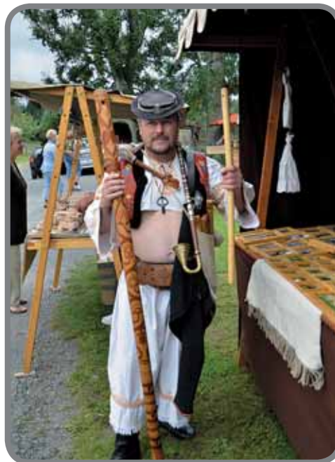
MFF Soláň 2011

V sobotu 11. srpna 2012 v odpoledních hodinách bude probíhat hlavní program festivalu v amfiteátru u Hor-