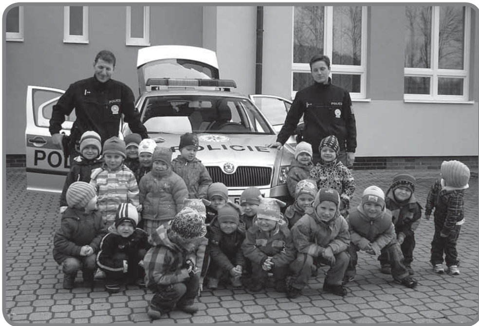
Den s Policií ČR pro MŠ

Pohled do kalendáře naznačuje, že do konce čtvrtletí máme ještě celý červen, ale duben a květen přinesly do školního života tolik nového, že nezbyvá, než se s tím karolinské veřejnosti „zateplá“ svěřit. Děláme to ostatně i průběžně na webových stránkách www.zskarolinka.cz .