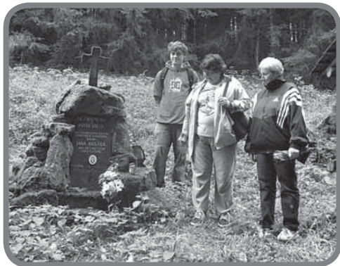
Účastníci pietního aktu

Při příležitosti osvobození Karolinky se konal 4. května 2012 vzpomínkový akt na oběti z druhé světové války u památníku na Jaseníkové. V tomto článku si krátce připomeneme, proč je památník obětí právě na Jaseníkové: „Pro obyvatele pasek na Jaseníkové byl tragickým dnem 5. leden 1945, kdy