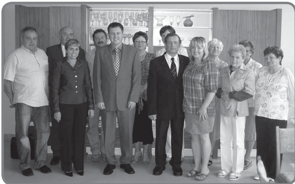
Zástupci VŠB - TU Ostrava, vedení Města Karolinky a účastníci U3V

Dne 25. května 2012 se sešli účastníci U3V v prostorách základní školy a obdr-