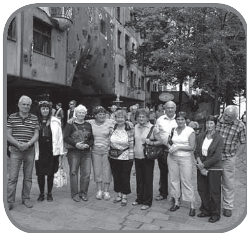
U3V Karolinka a její příznivci

Dne 7. června 2012 se zúčastnili žáci Základní školy Karolinka spolu s účastníky U3V (univerzity třetího věku) zájezdu do Vídně. Během jediného dne měli možnost poznat žáci a dospělí to nejkrásnější a nejzajímavější, co nabízí hlavní město