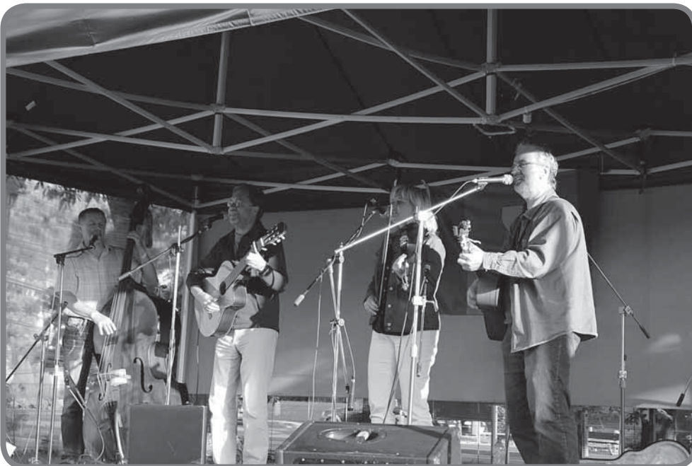
Vzpomínka na první ročník country festivalu v Karolince