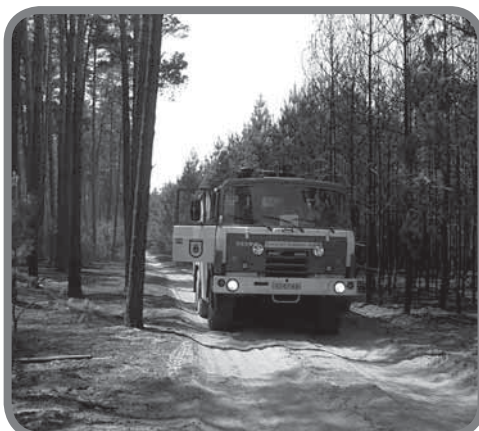
Naše Tatra v Bzenci