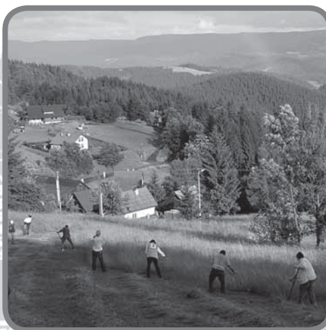
Sečení luk na Soláni 2011

Již po třinácté ožije vrchol hory Solán nad Velkými Karlovicemi na Valašsku slavností „Sečení luk na Soláni“. Uskuteční se v pátek 29. června 2012 a nabídnou soutěž sekáčů i folklorní vystoupení. Akce začne v 18 hodin na louce u Korytářů vedle Valašského ateliéru u Hofmanů. Návštěvníci uvidí ukázky tradičního sečení trávy kosou. Slavnostní salvou a prvním „zásekem luk“ se představí také portáši. Ti dříve na Valašsku střežili hranice a byli také známi svou dovedností. Mezi