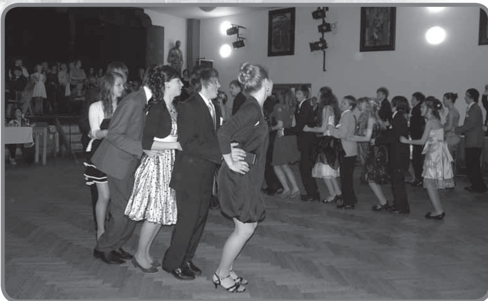
Předtaneční žáků 8. a 9. třídy