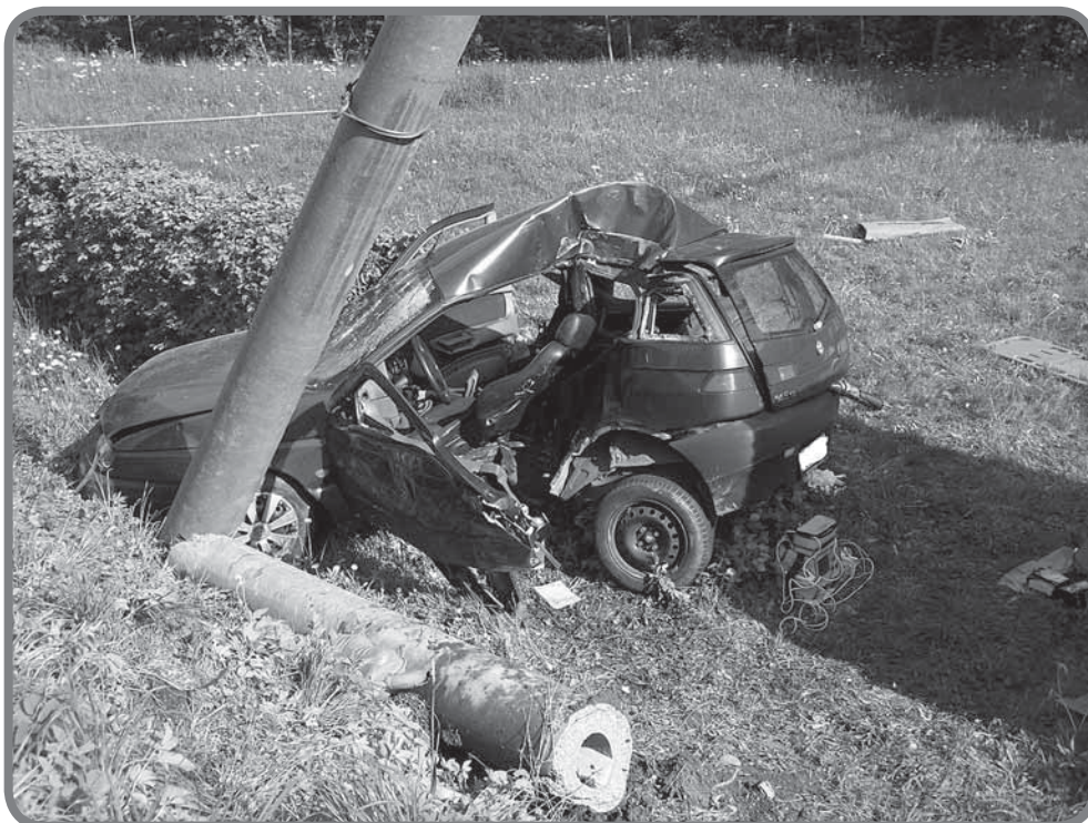
Dopravní nehoda v Podřátém