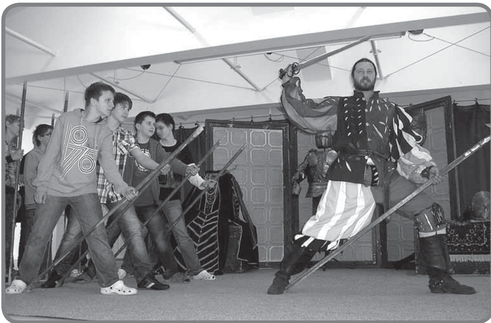
Renesanční vojenství spolu s Pernštejnou